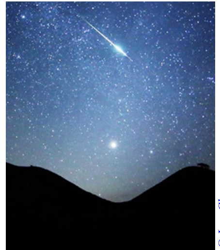
Метеор из потока Персеиды