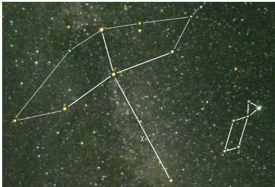
Снимок окрестностей созвездия Лебеда, на котором отмечено положение переменной звезды \chi Лебеда в области «шеи» Лебеда. Снимок получен 11 июля 2015 года, блеск звезды 5.0^m . Используйте это изображение, чтобы найти нужный участок неба при поиске переменной звезды.

Именно сейчас \chi Лебеда находится вблизи своей максимальной яркости. Текущая яркость звезды (на 31