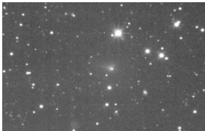
C/2010 X1 (Elenin) 21 мая 2011 года.

По материалам РИА Новости. www.rian.ru/science/20110507/371945235.html